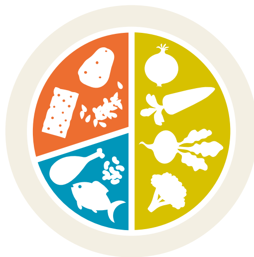
Om du rör på dig lite

Tallriksmodellen finns idag i två olika versioner. Den ena är för den som rör på sig mycket, och enligt rekommendationer. Den andra är för den som mest är still, och därför inte behöver lika mycket energi.