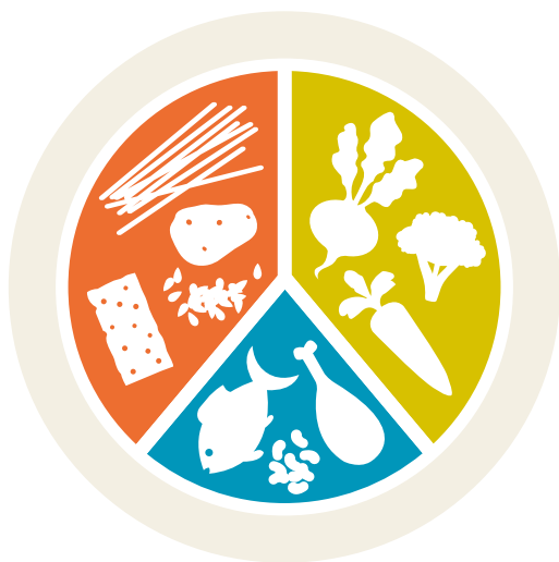
Om du rör på dig mycket

På 1980-talet pryddes de flesta skolsköterskors rum av Livsmedelsverkets planscher. Den så kallade tallriksmodellen som kom sedan visade procentuellt hur mycket protein, fett och kolhydrater man skulle äta. Rekommendationerna var tänkta att vägleda oss, tala om för oss vilken typ av mat vi mådde bra av, och vad vi skulle äta för att inte bli överviktiga eller sjuka av maten.