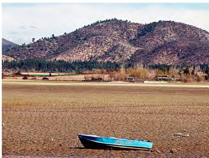
Torkkatastrofer tvingar många att överge nomadlivet och söka sig söderut till savannområdena.